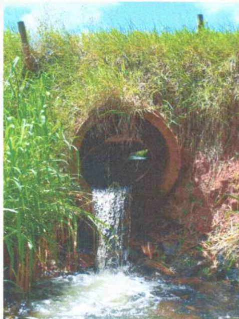
Figura 1: Córrego da Rancharia

A travessia sobre este curso d'água foi feita com aterro sobre tubos de concreto (elementos destinados a drenagem de águas pluviais), que devido às ações de forças impostas pelo tráfego e outros fatores relacionados às intempéries climáticas, rompeu-se e tem representado um risco considerável para a segurança dos moradores e usuários desta estrada, especialmente durante períodos de chuvas intensas, quando a passagem pode tornar-se intransitável e perigosa. Até a presente data estimamos que o tubo de concreto sob o qual foi feita a travessia esteja com menos da metade de sua capacidade de vazão, o que pode ser observável a partir da foto tirado no local.