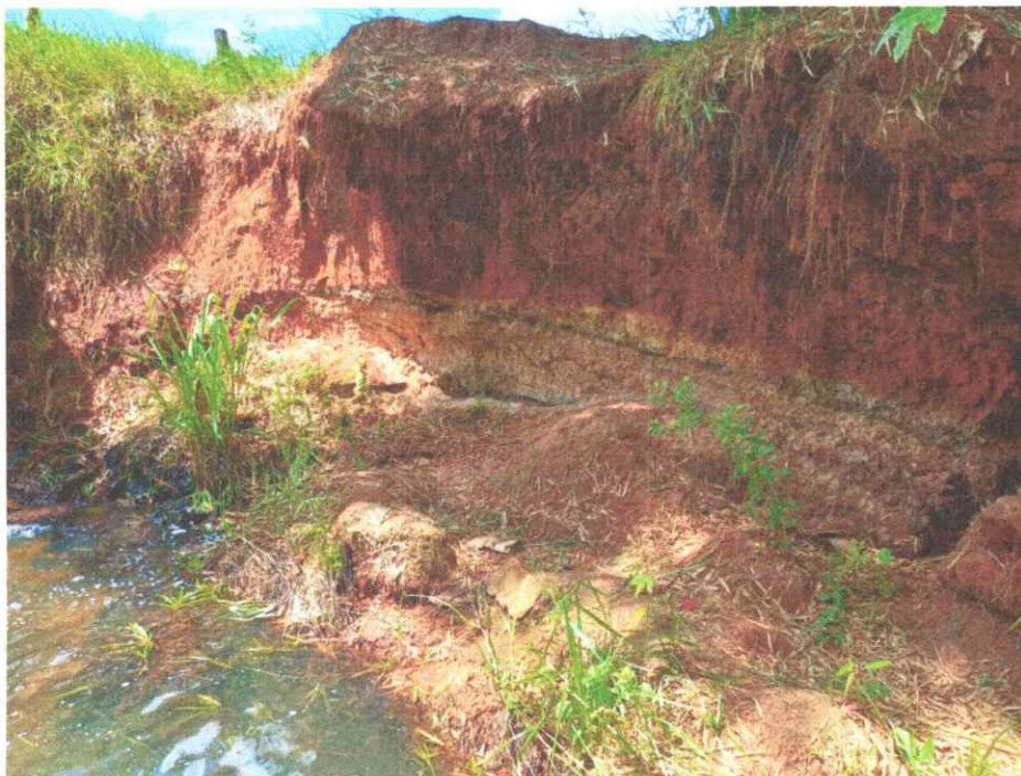
Figura 2: Processo de erosão no solo subjacente ao Córrego da Rancharia.

A travessia atual também tem causado impactos ambientais negativos, como a erosão das margens do curso d'água e a degradação do solo adjacente.